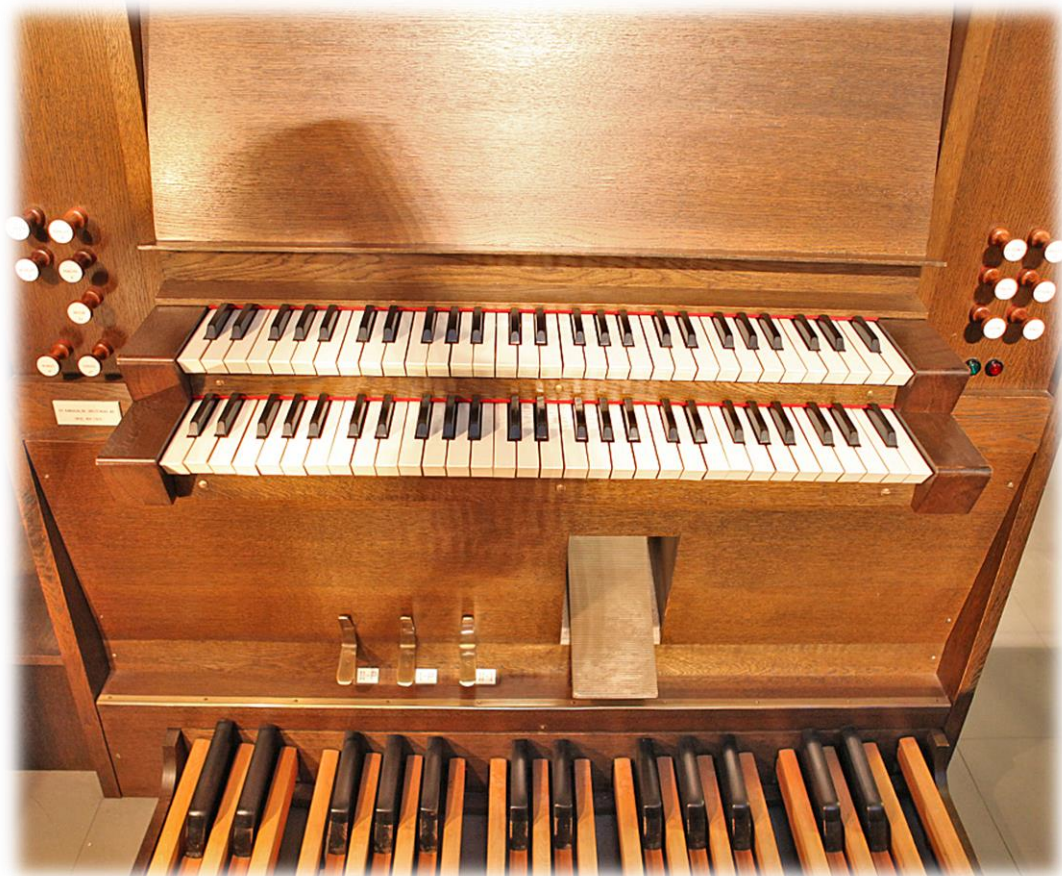
Ilmari Oikarainen (Opinnäytetyö: Säestyssoitinten vuosisata)